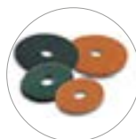
Vari tipi di pad