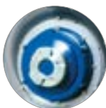
Attacco disco trascinatore e spazzole