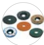
Ampia gamma pad e spazzole