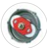
Riduttore a satelliti e planetario