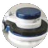
Possibilità uso peso aggiuntivo