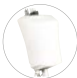
Serbatoio 12 l