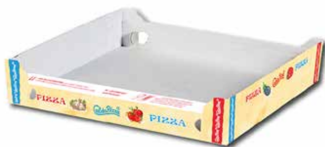
IMMAGINE E DISEGNO TECNICO